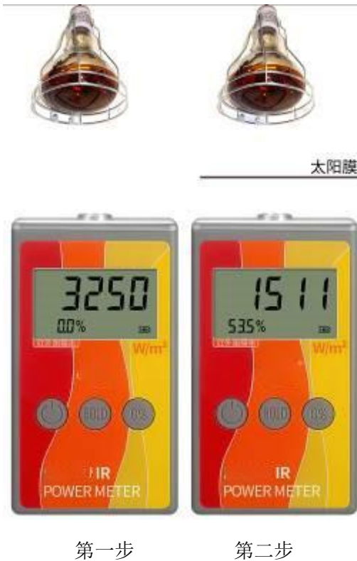
图 1 对太阳膜隔热性能的测量