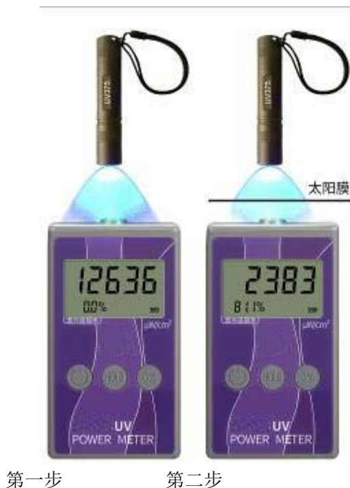
图 1 对太阳膜隔紫外性能的测量

紫外光源可选太阳光或紫外灯等。首先测量光源的紫外照度 W_{UV1} 。在此情况下，按下“0%”键，设定阻隔率基准值为 0%。