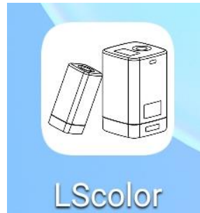
安装完成后 APP 图标