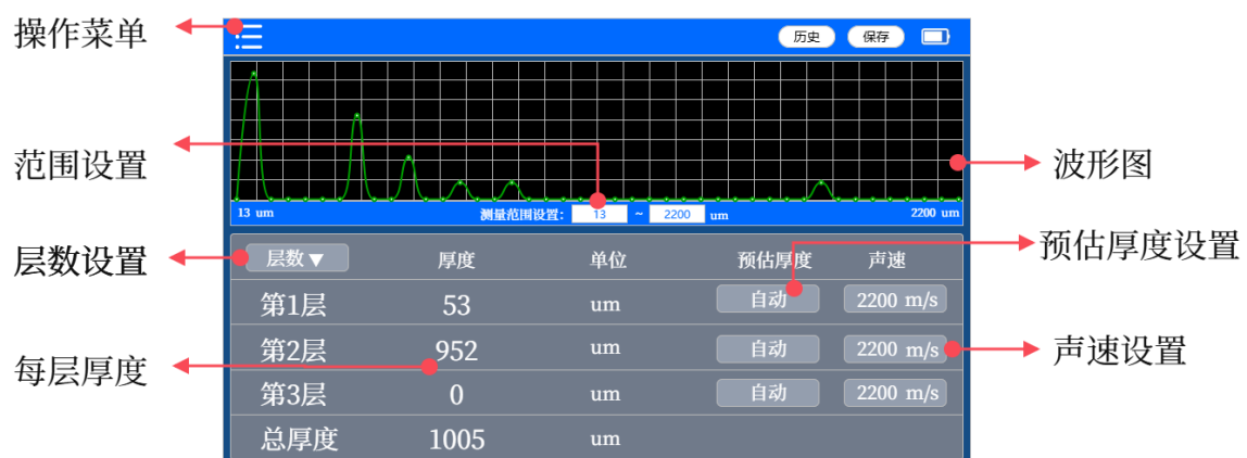
测量 3 层厚度结果

在被测材料表面涂上耦合剂，将仪器探头紧压在有耦合剂的材料表面并保持不动，蜂鸣器响后测量完成，可测得被测物的厚度。