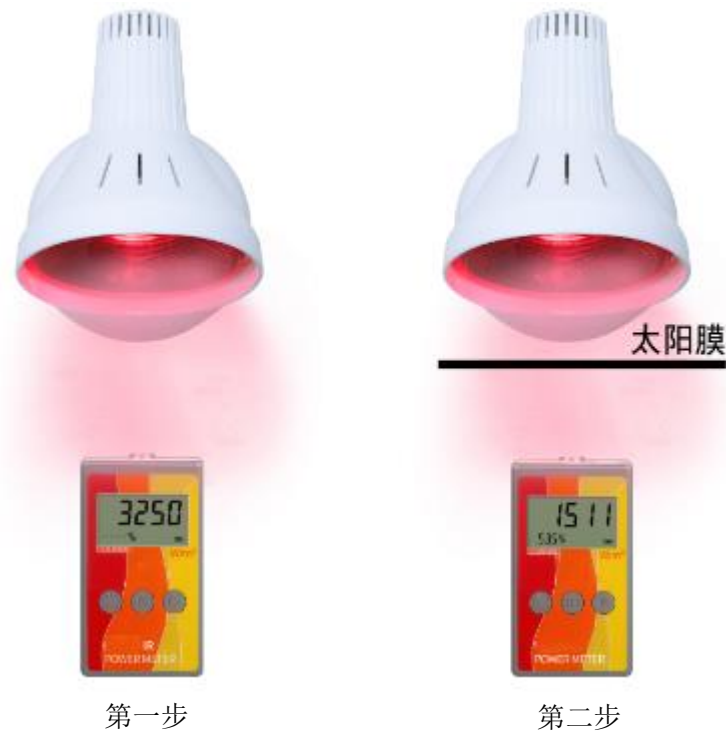
图 1 对太阳膜隔热性能的测量

红外光源可选太阳光或红外灯等。首先测量光源的红外照度 W_{IR1} 。在此情况下，按下“0%”键，设定阻隔率基准值为 0%。